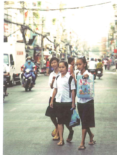
I ett land med snabbt växande ekonomi blir det lätt stor efterfrågan på utbildad arbetskraft. Det blir då ännu viktigare att fler får gå i skolan.