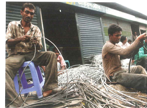
En fungerande infrastruktur är nödvändig för att ett land ska kunna utvecklas. De här männen arbetar med att återvinna metall ur kablar, en växande industri i Bangladesh.